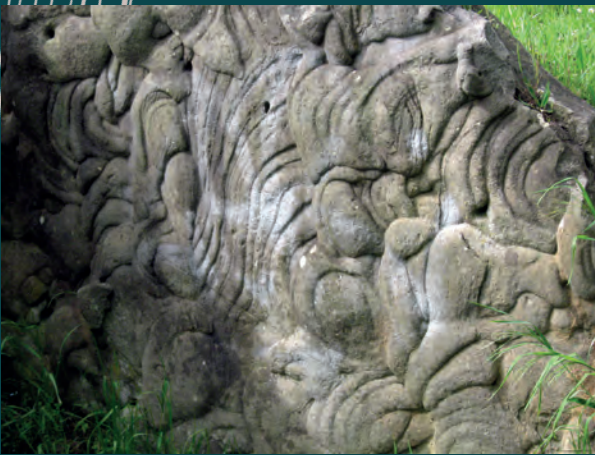
▲ Reliefs naturels des dalles